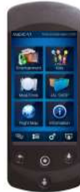
ビジネスクラス 機内エンターテインメント 用